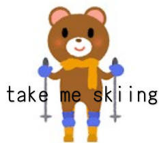
take me skiing