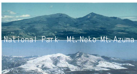
National Park Mt. Neko Mt. Azuma