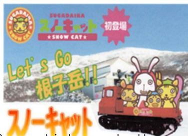
Snow vehicle go to the mountaintop