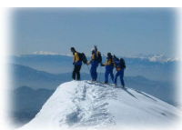
Mt. Azuma summit