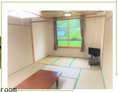
客室 guest room